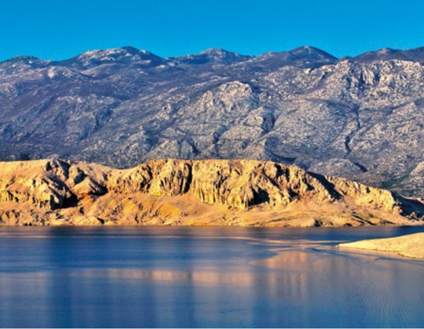
FORTICA - PAG